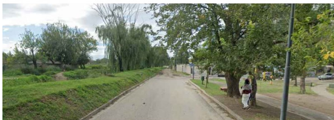
Cross-section - existing condition Villa Libertador . AA' . 250 ème