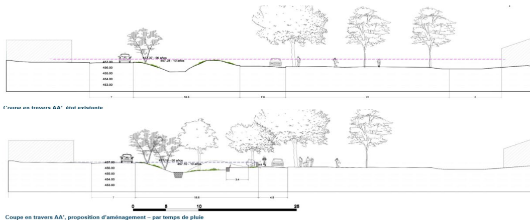
Coupe en travers AA', état existante

L'ensemble des solutions combinées permet d'aboutir à une ligne d'eau contenue dans l'ouvrage canal, permettant d'épargner les riverains des inondations pour la période de retour décennale. Pour la période de retour 50 ans, l'emprise d'inondation est fortement diminuée. Il est aussi calculé une baisse d'en moyenne 15 cm sur les inondations résiduelles autour du canal.